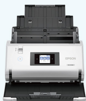
Epson DS-31200 A3高速馈纸式彩色文档扫描仪